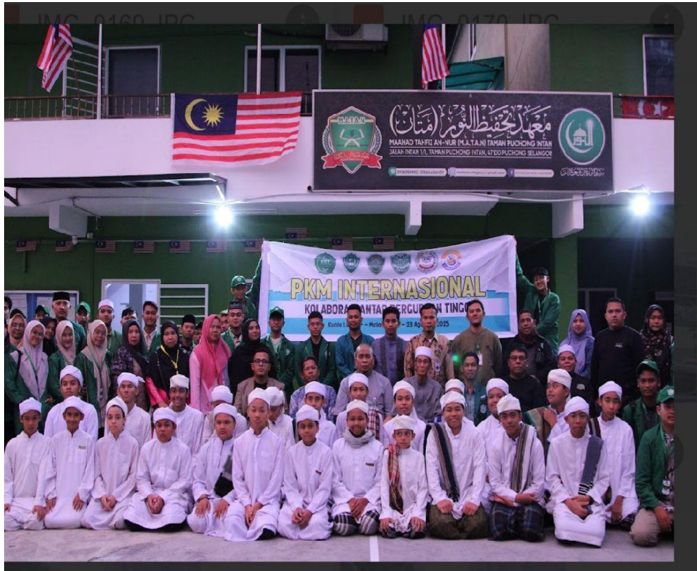
Gambar 3. Foto Bersama Dengan Peserta PKM

Kegiatan PKM telah berjalan lancar dengan diikuti sebanyak 50 Peserta. Kegiatan ini merupakan implementasi MoU antara Sekolah Tinggi Ilmu Ekonomi Al – Washliyah Sibolga dengan dengan Maahad Tahfidz An-Nur (MATAN) Pucong, Malaysia nomor: M.A.T.A.N/047/VIII/2025, yaitu kerjasama dalam bidang Tridharma Perguruan Tinggi.