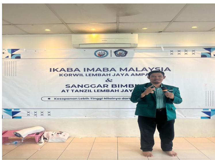
Gambar 2. Gambar Penyampaian PKM.

Guru/ Dosen berperan sebagai teladan dan fasilitator utama. Melalui keteladanan sikap, integrasi nilai karakter ke dalam pembelajaran, serta pembiasaan positif di sekolah, guru/ dosen membantu peserta didik memahami, menginternalisasi, dan mempraktikkan nilai-nilai tersebut secara konsisten. Dengan manajemen SDM yang baik, guru lebih siap menjalankan peran ini secara profesional dan berkesinambungan.