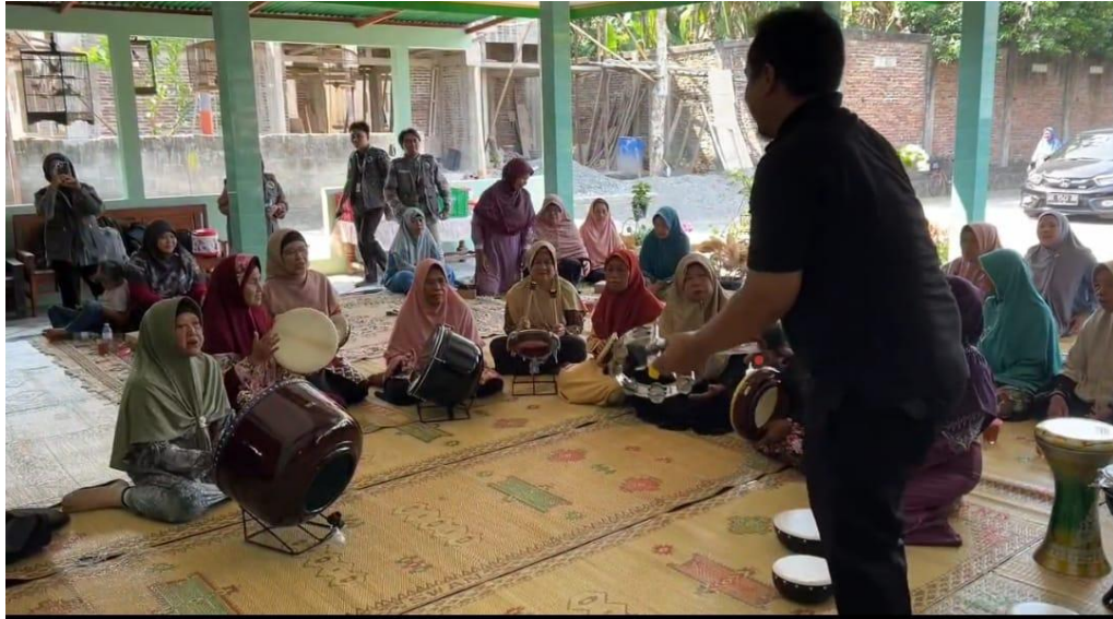
Gambar 4. Kegiatan peningkatan kapasitas manajerial dan sosial lansia di Argorejo

meningkatkan pengalaman emosional positif serta meningkatkan relasi sosial. Program Sekolah Lansia Integrasi juga menunjukkan bahwa pemberian ruang dialog, edukasi kesehatan, dan aktivitas kelompok dapat meningkatkan motivasi dan rasa bermakna di usia senja (Hartanto, Sudarsono and Puspitasari, et al. 2024).