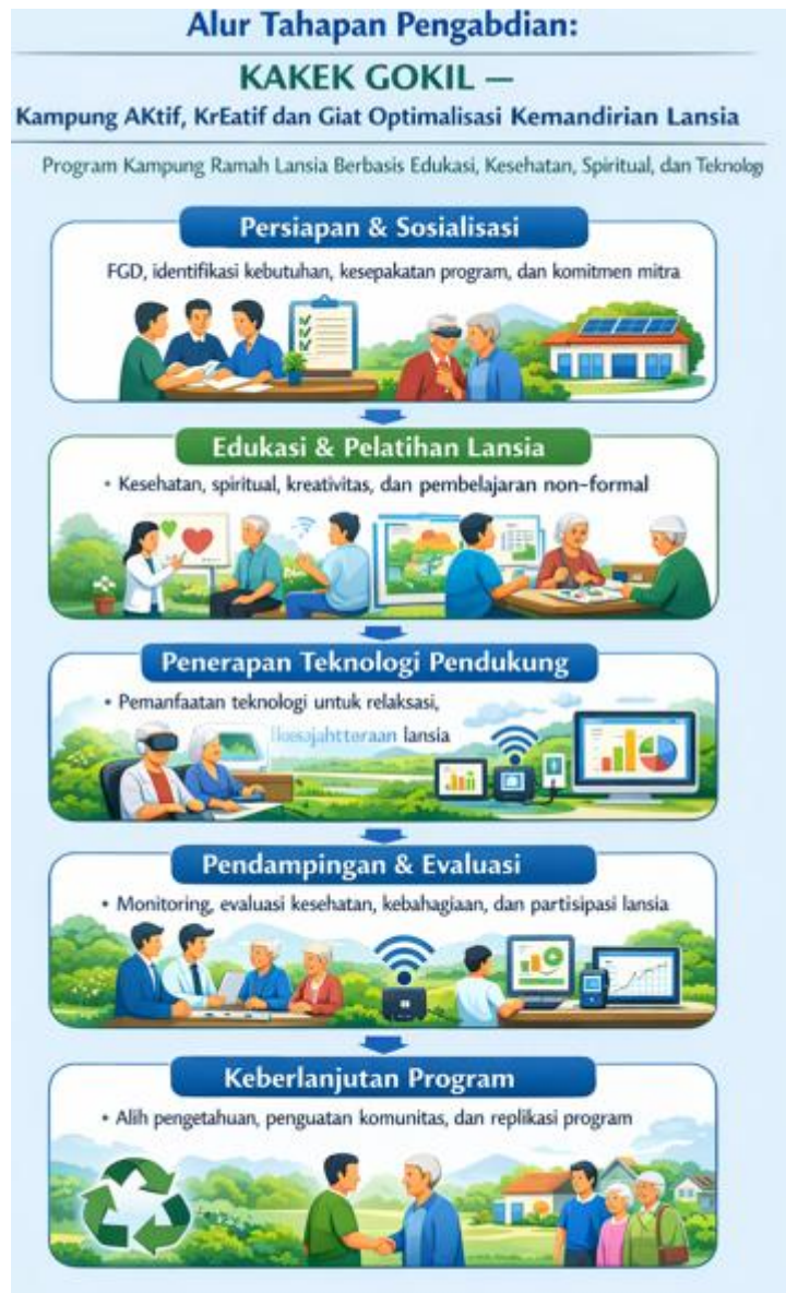
Gambar 1. Alur tahapan pengabdian