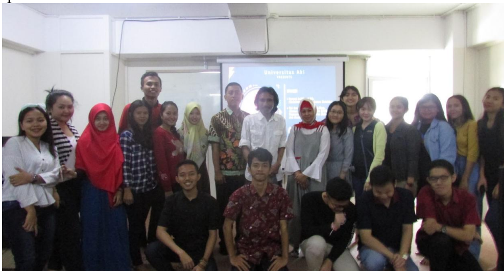
Gambar 2. Peningkatan Literasi Transformasi Profesi Akuntansi

Selain itu, siswa menunjukkan peningkatan kesadaran terhadap pentingnya penguasaan teknologi, seperti software akuntansi dan sistem informasi keuangan. Kegiatan ini juga meningkatkan minat siswa untuk mengembangkan kompetensi diri melalui pelatihan tambahan dan sertifikasi.