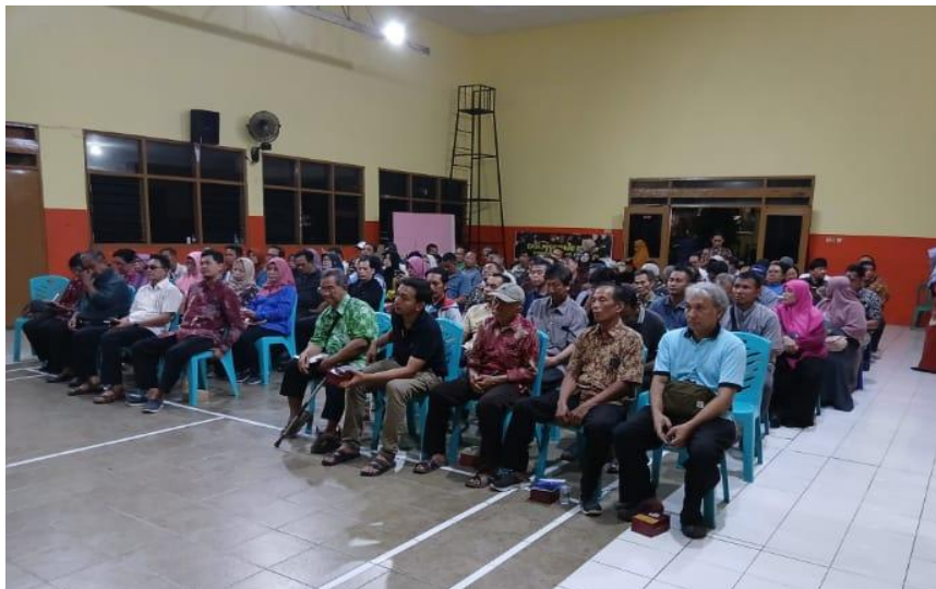
Gambar 1. Kegiatan di CV Fajar Anugrah

Dalam konvergensi bisnis global yang kompetitif, urgensi ketersediaan informasi keuangan yang relevan menjadi variabel fundamental dalam menentukan arah kebijakan organisasi. Beberapa peneliti mendefinisikan Sistem Informasi Akuntansi (SIA) sebagai instrumen vital yang bertransformasi menjadi penyedia data primer bagi para pemangku kepentingan dalam memitigasi risiko ketidakpastian. Signifikansi SIA dipertegas oleh Paramitha dan Mulyadi (2017) serta (Jawad, 2023) yang mengemukakan bahwa efektivitas administrasi dalam merancang rencana strategis sangat bergantung pada kualitas luaran sistem yang diimplementasikan. Tanpa sistem yang andal, organisasi cenderung terjebak pada intuisi subjektif dibandingkan analisis berbasis data.