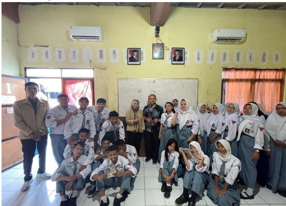
Gambar 1. Narasumber dan Siswa SMK Swadaya Semarang

Siswa SMK sebagai bagian dari generasi produktif memiliki potensi besar dalam memahami konsep keuangan dan investasi, namun masih menghadapi keterbatasan dalam penerapan pengetahuan tersebut secara praktis. Beberapa penelitian menunjukkan bahwa literasi keuangan memiliki pengaruh signifikan terhadap kemampuan pengelolaan keuangan dan pengambilan keputusan investasi pada siswa (Inestiana et al., 2024). Selain itu, literasi keuangan digital juga menjadi faktor penting dalam mendukung kesiapan siswa menghadapi perkembangan teknologi finansial dan meningkatkan minat kewirausahaan (Nurisman et al., 2024). Meskipun demikian, masih banyak siswa yang belum mampu membedakan antara kebutuhan dan keinginan, serta belum memiliki kebiasaan dalam menyusun perencanaan keuangan sederhana (Taufik et al., 2025).