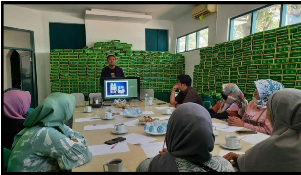
Gambar 1. Kegiatan pelatihan

pemahaman dan pelatihan yang memadai, teknologi tersebut belum dimanfaatkan secara optimal oleh para pelaku UMKM.