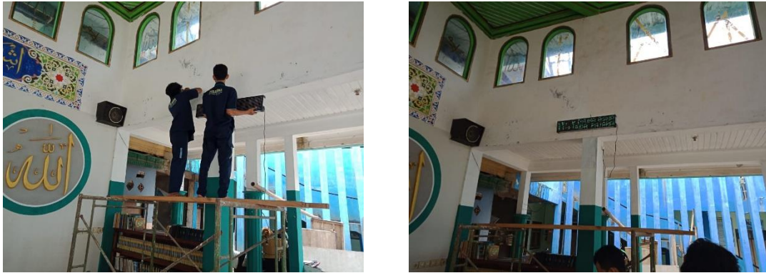
Gambar 9. Pemasangan Running Text LED