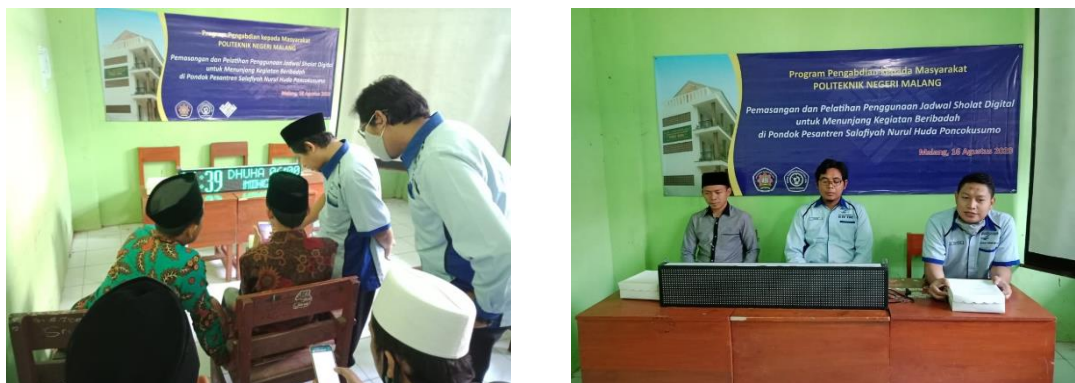
Gambar 6. Pelatihan Mengoperasikan Running Text LED

Tahap ketiga adalah pelatihan mengoperasikan running text LED tentang cara mensetting, mengoperasikan, dan merawat running text LED tersebut. Sebagai narasumber adalah tim dari Jurusan Teknik Mesin Politeknik Negeri Malang dan sebagai pihak peserta ialah takmir dan santri Mushola Nurul Huda seperti yang terlihat pada Gambar 6. Pelatihan diselenggarakan di aula kelas Ponpes Nurul Huda pada tanggal 16 Agustus 2020.