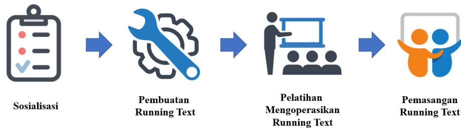
Gambar 1. Flowchart Tahapan Kegiatan

Metode yang digunakan dalam kegiatan pengabdian ini adalah metode Participatory Rural Appraisal (PRA) yaitu kegiatan yang melibatkan masyarakat sasaran dalam pelaksanaannya. Terdapat 4 (empat) tahapan kegiatan utama dalam pelaksanaan kegiatan ini seperti flowchart pada Gambar 1, dengan rincian sebagai berikut: