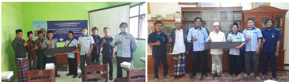
Gambar 10. Serah Terima Running Text LED kepada Pihak Ponpes Nurul Huda.

Kegiatan pengabdian kepada masyarakat ini telah selesai dan berhasil dilaksanakan dengan baik. Perangkat jam digital jadwal sholat telah diserahkan kepada pengurus Mushola Nurul Huda Pajaran Kecamatan Poncokusumo, Malang. Dengan adanya running text ini diharapkan dapat bermanfaat bagi pengurus dan jamaah Mushola Nurul Huda dalam melaksanakan sholat tepat waktu dan keteraturan/kebersamaan jamaah melakukan sholat sunah antara azan dan iqomah. Gambar 12 memperlihatkan suasana serah terima running text LED secara langsung kepada pimpinan pondok pesantren dan sekaligus takmir Mushola Nurul Huda.