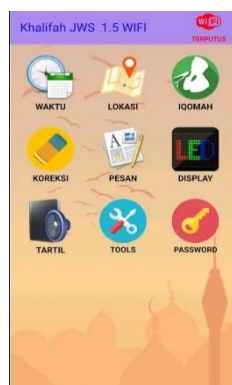
Gambar 7. Tampilan Utama Aplikasi Khalifah JWS 1.5 WiFi

Pada menu ini bisa diatur teks apa saja yang akan ditampilkan pada layar running text LED , diantaranya adalah pesan pembukaan, format tanggal, pesan ketika azan dan iqomah, pesan untuk meluruskan saf , pesan khusus ketika khotbah jumat, dan pesan terjadwal. Gambar 7 dan Gambar 8 menunjukkan tampilan fitur utama dan fitur setting display .