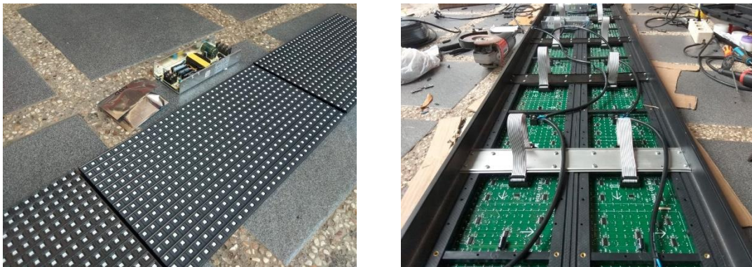
Gambar 3. Proses Pembuatan Running Text LED

Setelah kode pemrograman dimasukkan ke algoritma, kemudian dilakukan perakitan mekanik running text LED . Sistem ini dirancang agar penyetingan karakter dapat dikendalikan menggunakan smartphone android . Skematik wiring komponen pada NodeMCU dapat dilihat pada Gambar 4 (Taryudi dan Budi 2018). Sementara itu Gambar 5 menjelaskan cara kerja sistem (Nataprawira, Rizal, dan Wibowo 2020). Pada display dot matriks juga dapat disetting untuk bergeser dari kiri ke kanan dengan kecepatan para pembaca normal 200- 250 kpm (kata per menit), dengan waktu pengiriman teks kurang dari satu detik (Mulyati, 2009).