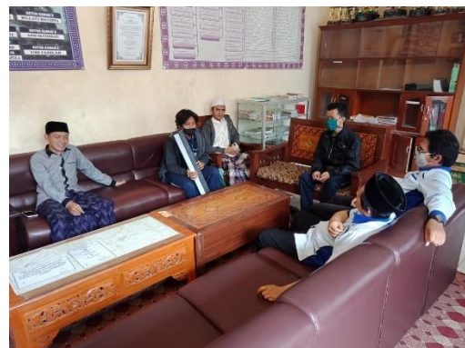
Gambar 2. Sosialisasi ke Mushola Nurul Huda dan Pihak Takmir