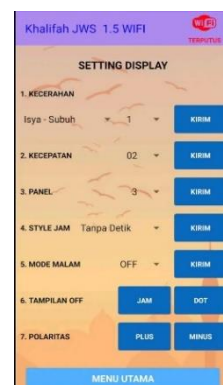
Gambar 8. Tampilan Setting Display