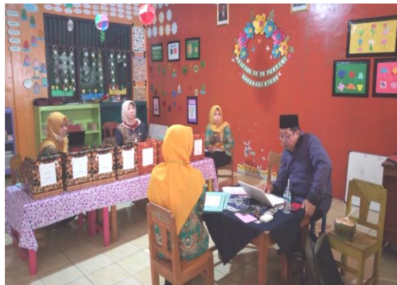
Gambar 8. Verifikasi

Jumlah Standar yang di-entry pada EDS Pemetaan yaitu :