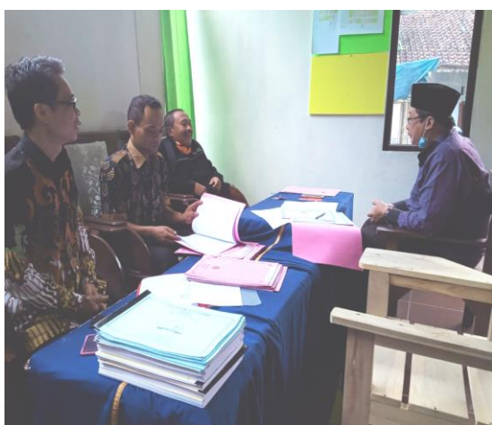
Gambar 4. Verifikasi Al Hidayah

Jumlah Standar yang di-entry pada EDS Pemetaan yaitu :