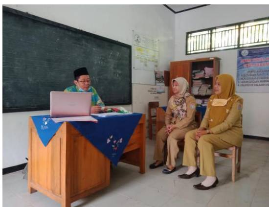
Gambar 3. Verifikasi

Jumlah Standar yang di-entry pada EDS Pemetaan yaitu :