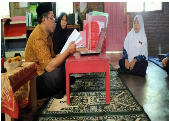
Gambar 7. Verifikasi

Jumlah Standar yang di-entry pada EDS Pemetaan yaitu :