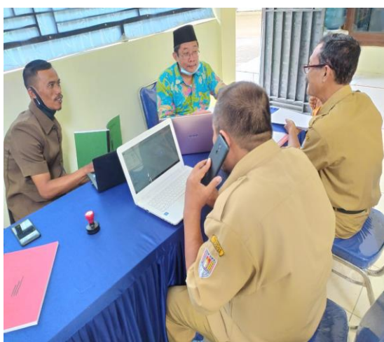
Gambar 2. Verifikasi

Jumlah Standar yang di-entry pada EDS Pemetaan yaitu :