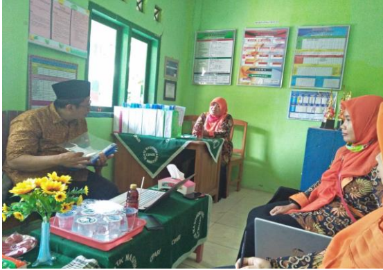
Gambar 6. Verifikasi

Jumlah Standar yang di-entry pada EDS Pemetaan yaitu :