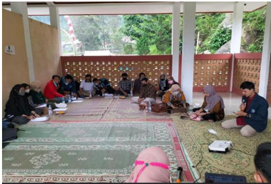
Gambar 2. Pelatihan SDM

SDM dalam organisasi atau perusahaan besar maupun kecil dapat dilakukan melalui kegiatan pendidikan dan pelatihan.