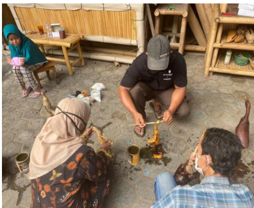
Gambar 6. Pelatihan Inovasi Produk

Penambahan dengan memberikan desain batik kayu pada produk menjadikan produk Abia Art memiliki desain etnis yang memiliki nilai seni yang tinggi (Hamid 2018). Penginovasian produk batik yang dilaksanakan dengan rekayasa serta desain hias mempunyai peranan yang krusial sebagai penentu kesuksesan produk yang dihasilkan (Matahari et al. 2013). Peranan desain pada kesuksesan penciptaan produk sangat tinggi selain dilihat dari perekonomian serta pengelolaannya (Bukit, Malusa, and Rahmat 2017). Prosedur merancang desain adalah pengungkapan nilai seni serta fungsi produk melalui metode tertentu untuk menghasilkan produk berkualitas dan estetik untuk mencukupi kebutuhan pelanggan. Selain itu, membuat batik melalui wadah kayu adalah bentuk inovasi dari proses yang biasa dilakukan.