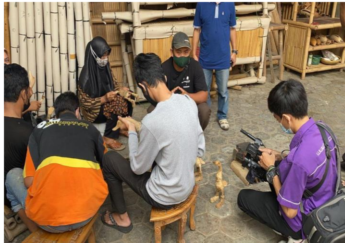
Gambar 4. Pelatihan Desain Batik Kayu