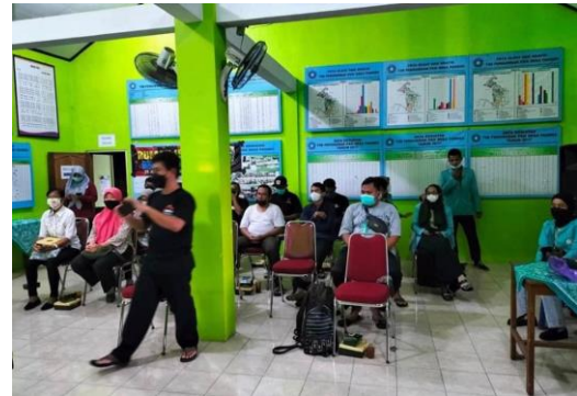
Gambar 3. Pelatihan Pengembangan Desain