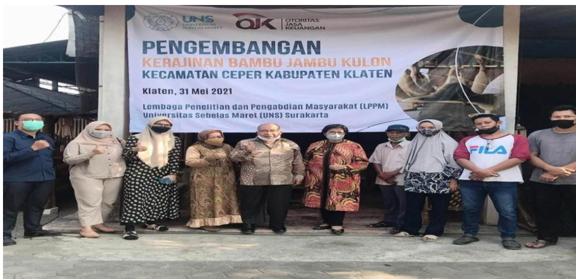
Gambar 5. Tim Pengabdian beserta responden