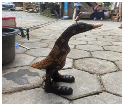
Gambar 7. Hasil Inovasi Produk